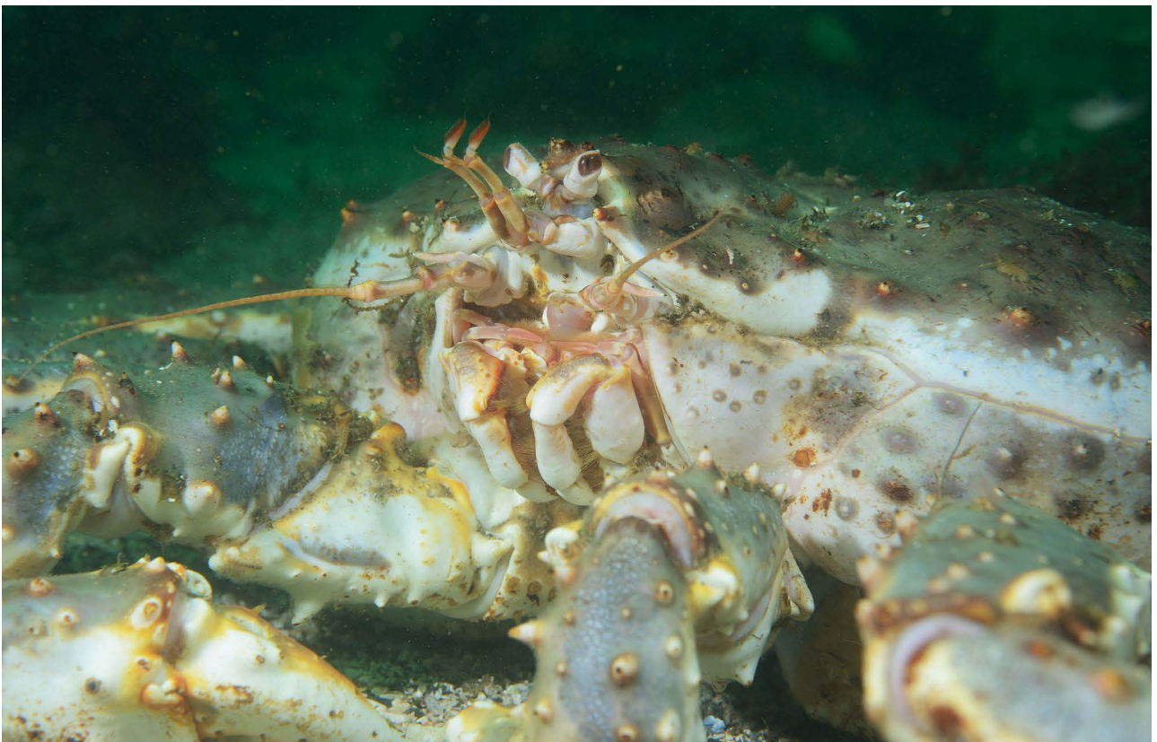
Камчатский краб Paralithodes camtschaticus .