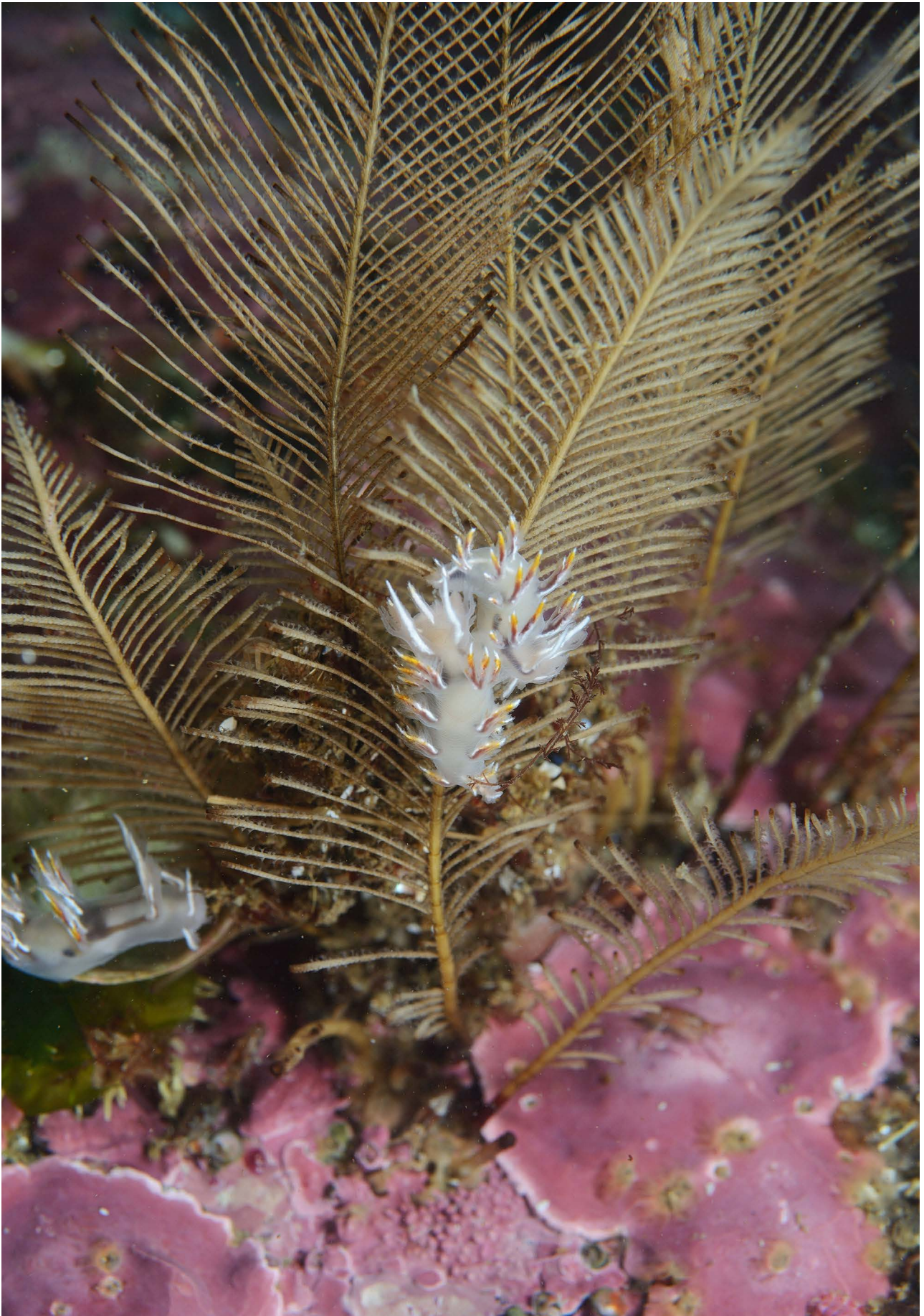
Голожаберные моллюски Dendronotus robilliardi на гидроидах Abietinaria annulata .