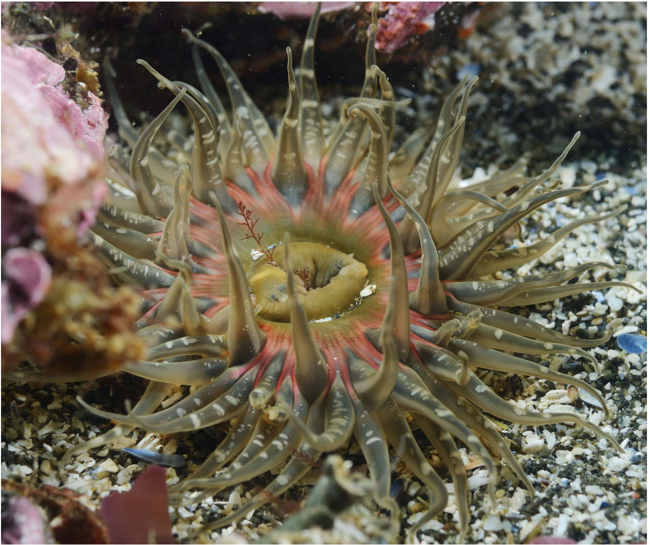
Актиния Anthopleura orientalis , популяция этого вида практически не пострадала.