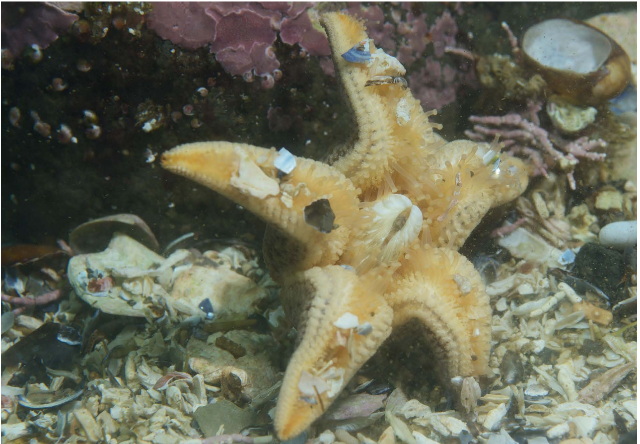
Небольшой экземпляр питающейся морской звезды Asterias rathbuni (вентральная сторона).