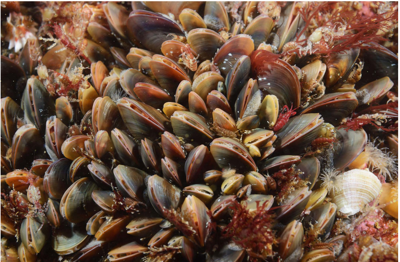
Друза мидий, справа – Nucella sp. и мелкие экземпляры актинии Metridium senile fimbriatum .