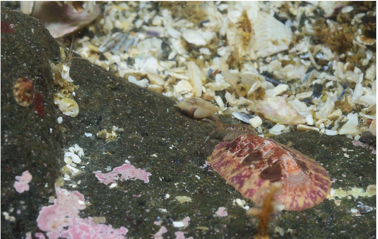
Панцирный моллюск – хитон семейства Tonicellidae.