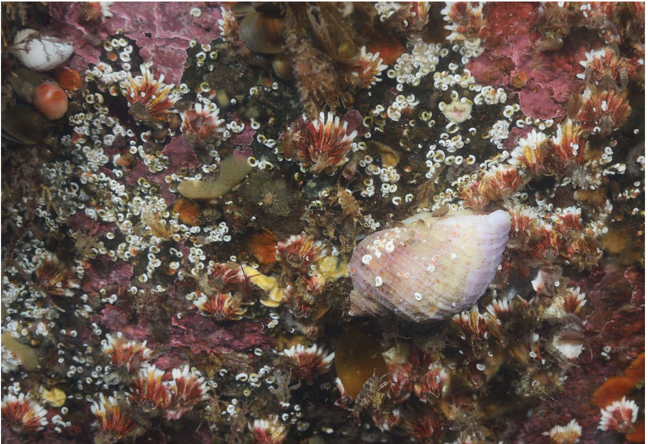
Брюхоногий моллюск Nucella sp., усонogie раки Balanus crenatus и мелкие сидячие полихеты Spirorbis sp.