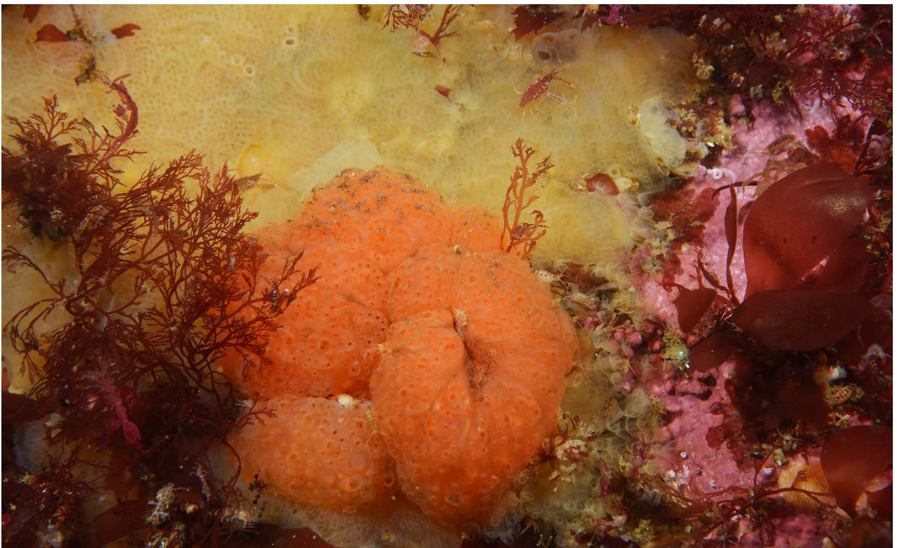
Колониальные асцидии Aplidium sp. (желтая) и Synoicum sp. (оранжевая).