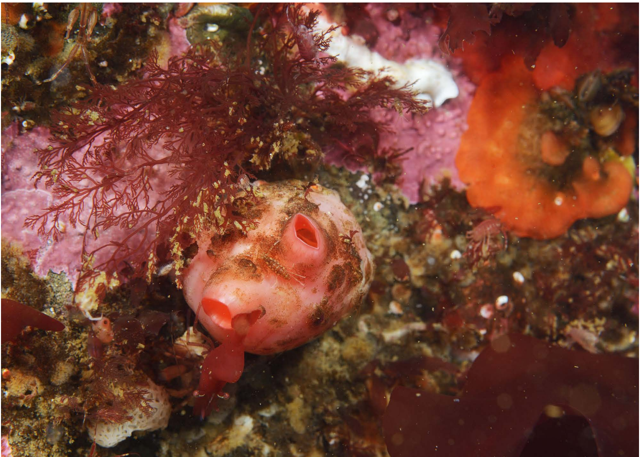
Асцидия Dendrodoa aggregata , слева внизу – известковая губка семейства Clathrinidae.