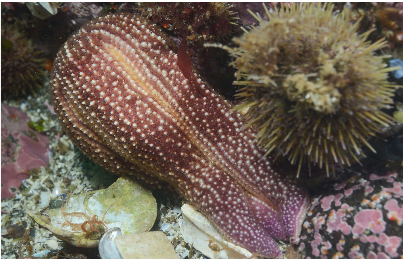
Питающаяся морская звезда Evasterias echinosoma .