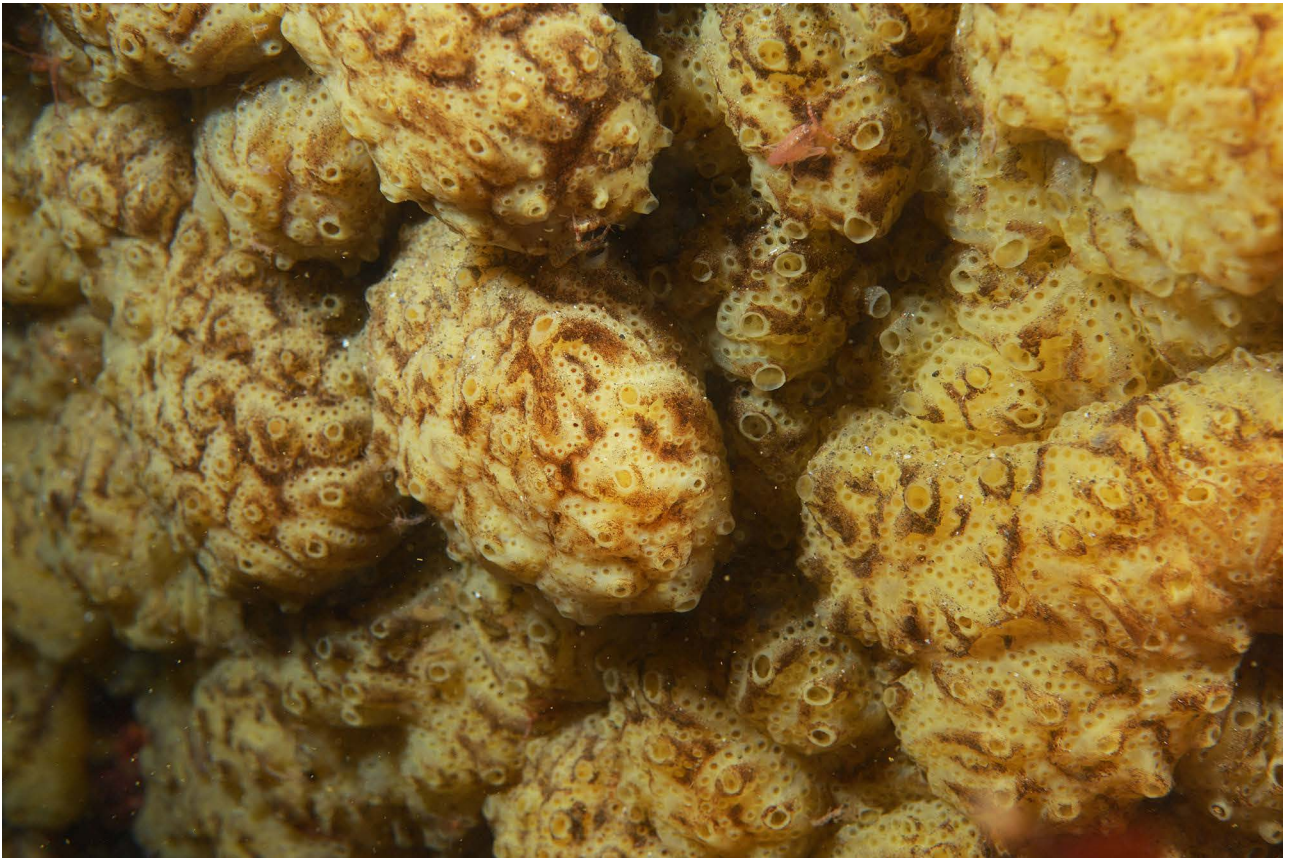
Большая колония асцидии Aplidiopsis pannosum .