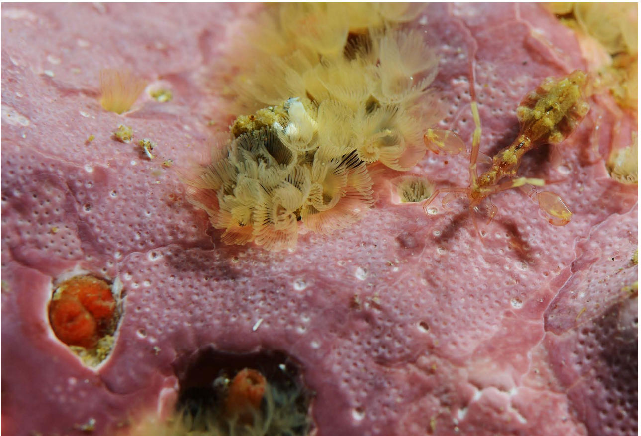
Форониды Phoronis sp., слева внизу – сифоны двустворчатого моллюска Hiatella arctica .