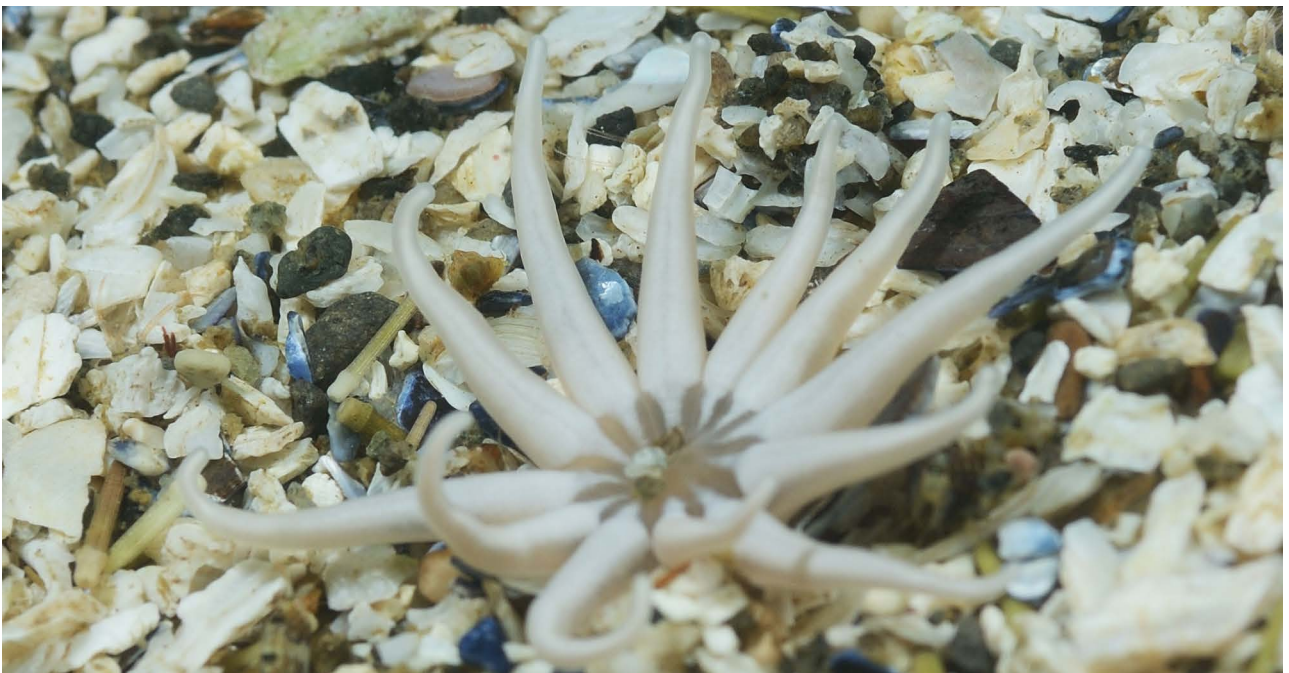
Роющая актиния Halcampoides sp.