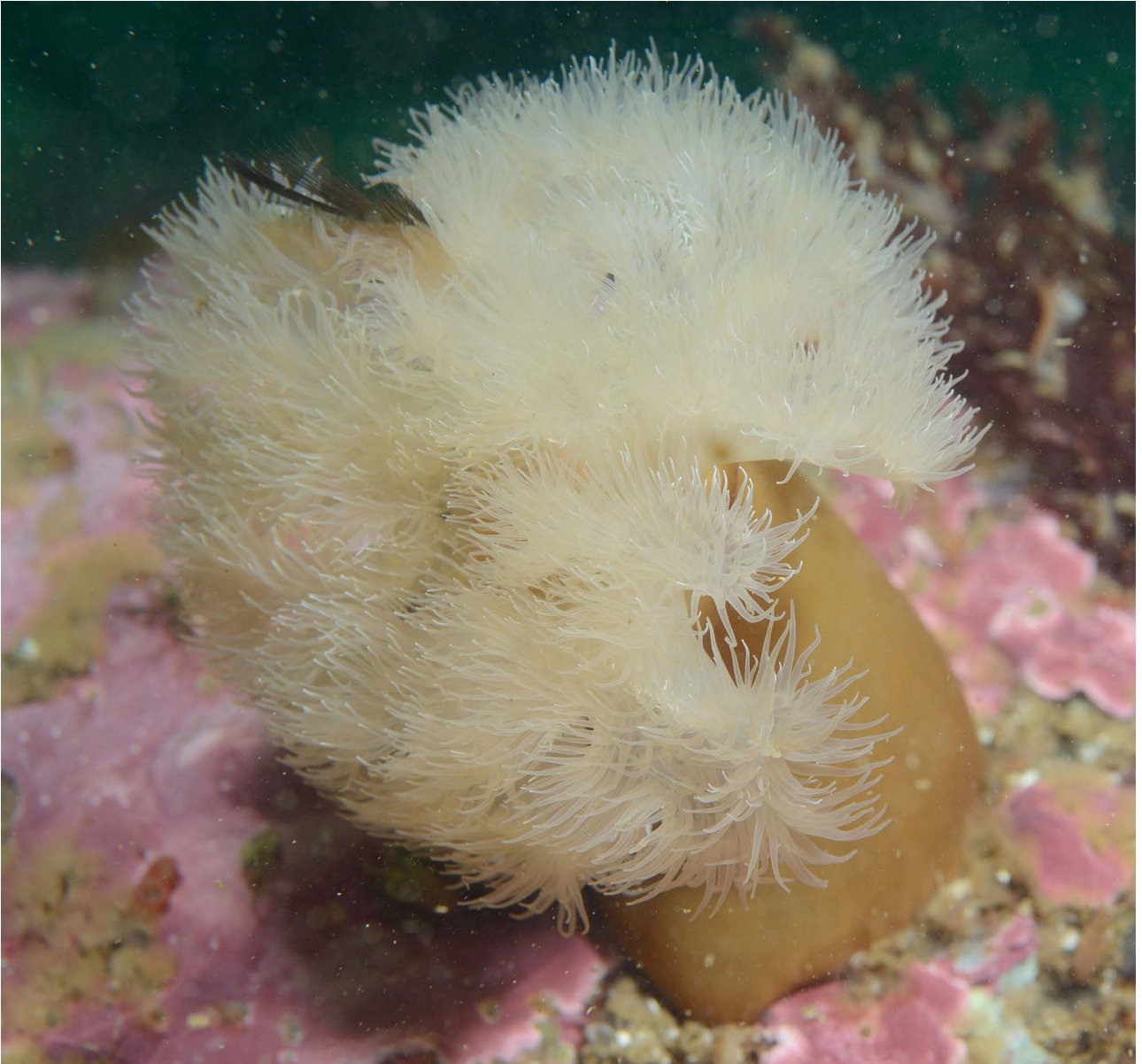
Крупный экземпляр актинии Metridium senile fimbriatum .