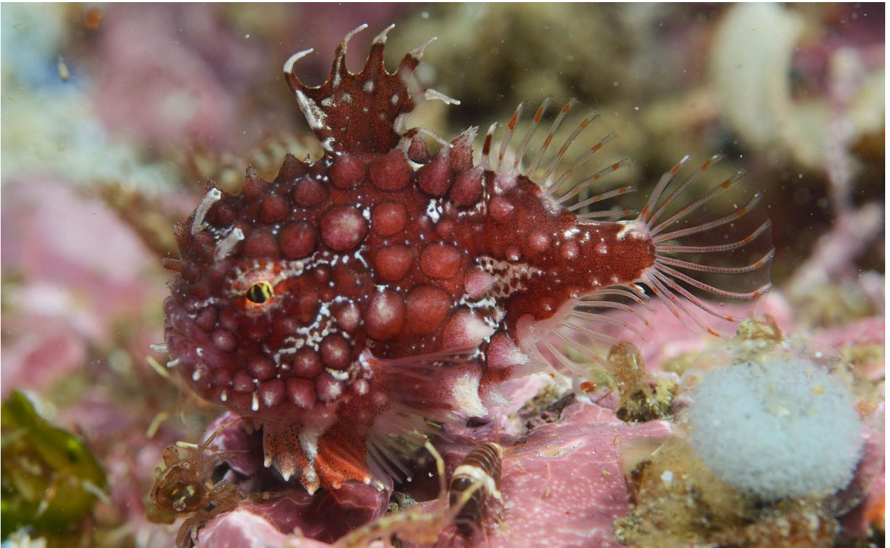
Круглопер (рыба семейства Cyclopteridae).