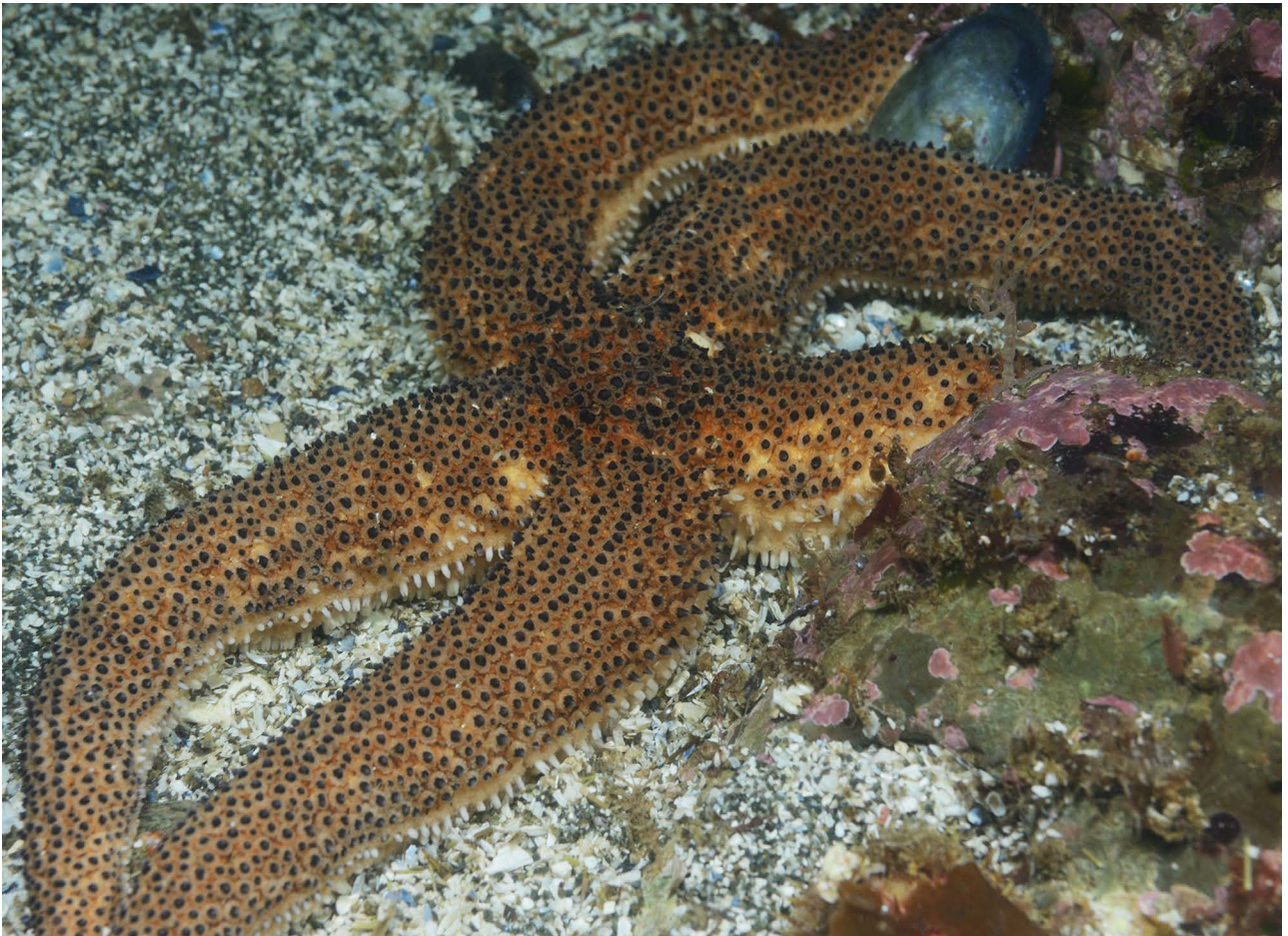
Морская звезда Lethasterias nanimensis chelifera .