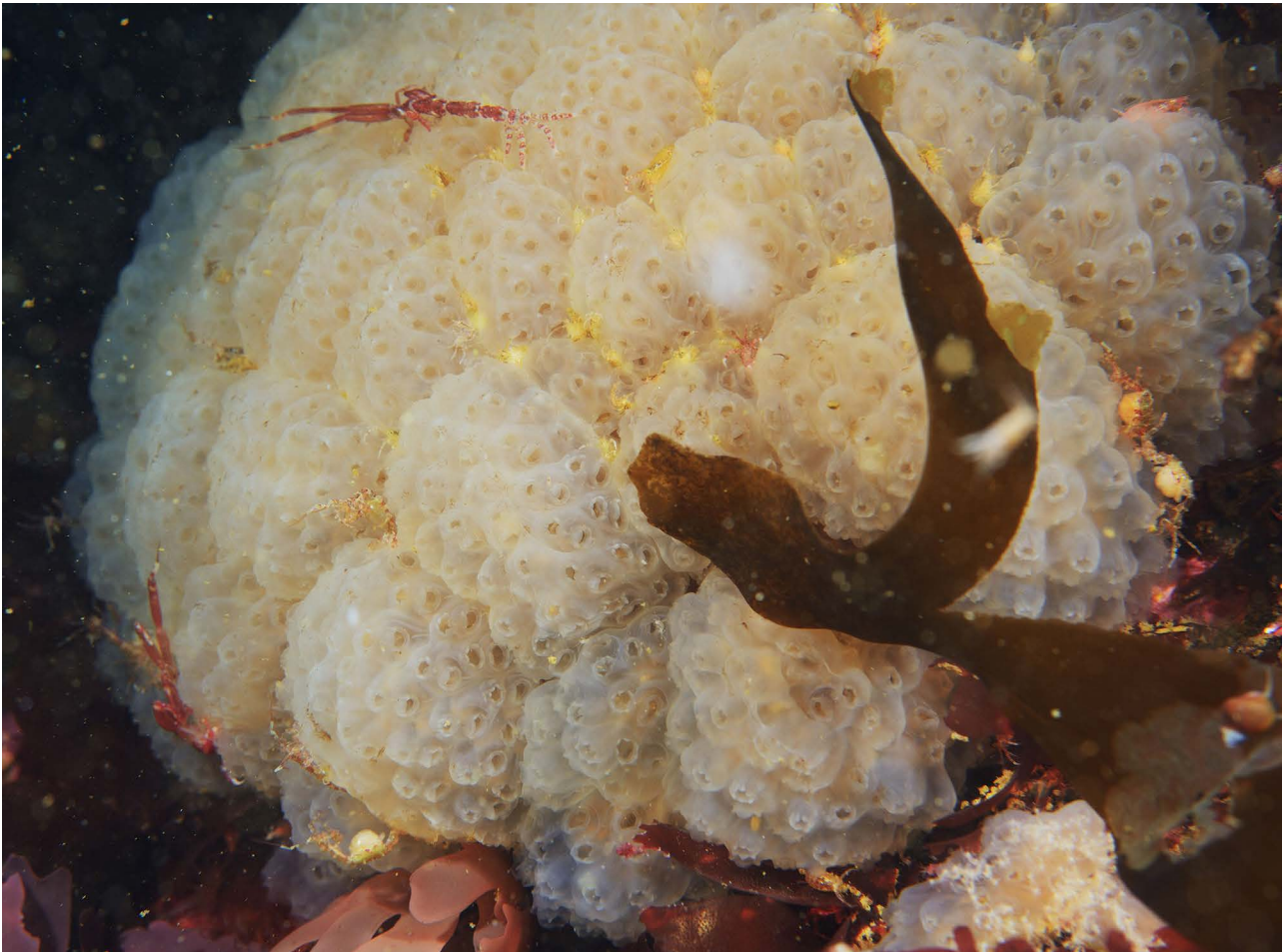
Колониальная асцидия Placentela crystallina .