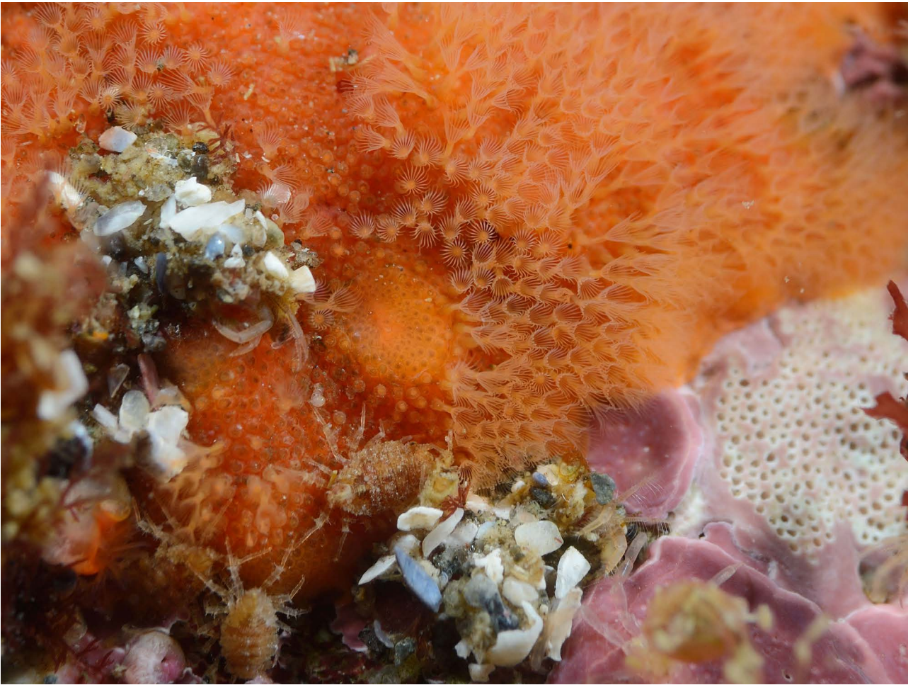
Корковая мшанка (видны отдельные зооиды), внизу – изоподы.