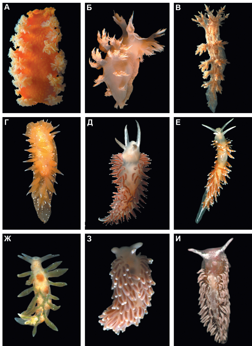
Рис. 10. А – Tritonia tetraquetra (Pallas, 1788); Б – Dendronotus dalli Bergh, 1879; В – Dendronotus frondosus (Ascanius, 1774); Г – Dironea pellucida Volodchenko, 1941; Д – Himantina trophina (Bergh, 1894); Е – Coryphella athadona Bergh, 1875; Ж – Nudibranchus rupium (Møller, 1842); З – Cuthonella soboli Martynov, 1992; И – Aeolidia papillosa (Linnaeus, 1761).